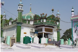
Mazaar Makhdoem Ashraf Jahangier Samnanie

Syed Makhdoom Ashraf Jahangier Simnanie Rahmatoellahi alaihi is een Walie (vriend) van Allah tabaraka wa taála en grondlegger van de Ashrafiya orde (silsila), geboren in het jaar 708 van de Islamitische jaartelling, in de provincie Simnan in Iran.