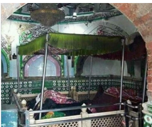
Mazaar Makhdoem Ashraf Ja- hangier Samnanie

Toen hij zeven jaar oud was had hij de Qurán uit het hoofd geleerd in alle zeven Qiraáts