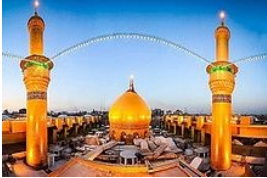
Mazaar van Imaam Hoesein Radieyallahoe anhoe

Moharram is de eerste maand van het Islamitische jaar en tevens één van de vier maanden die in vers 36 van surah at-Taubah als heilig (gerespecteerd) wordt genoemd. In deze maanden worden de goede daden extra beloond en de slechte daden worden zwaarder gestraft. Het is verboden om in deze maanden te vechten of oorlog te voeren. Deze maanden werden ook in de tijd van onwetendheid (voor de komst van de geliefde Profeet ﷺ (sallallahoe alaihie wa sallam)) gerespecteerd en als heilig beschouwd. Bij de Arabieren bestond het gebruik, dat als de heilige maanden begon, ze hun zwaarden weg zetten en stopten met vechten en plunderen. Zelfs als iemand de moordenaar van zijn vader of broer tegenkwam, werd hij er niet op aangesproken. Na de komst van de geliefde Profeet ﷺ werd de heiligheid en het respect van deze maanden verhoogd.