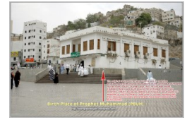
Geboortehuis van de Profeet ﷺ

De drie woorden zijn inderdaad de woorden van de heilige Profeet ﷺ, maar uitleg of vertaling van de Qurán en de Ahadith is niet voor iedereen weggelegd. Voor het vertalen en uitleggen van de heilige Qurán en de Ahadith van de geliefde Profeet is er veel andere kennis nodig, zoals taal, geschiedenis, tijd van de hadith, de praktijk van de metgezellen en de geleerden na hun. En naast kennis is liefde voor de geliefde Profeet van Allah ﷺ een groot vereiste. Om een lang verhaal kort te maken, de betekenis van de drie woorden "Koelloe bied'atien dalalatoen" is niet zoals de mensen, die de viering van de geboorte van de geliefde Profeet ﷺ weigeren, het vertalen "elke innovatie is dwaling", maar volgens de groot geleerden betekent het "de meeste innovaties zijn dwalingen".