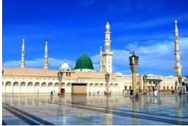
Masjid Nabawi, Madinah Shareef

Rabie-oel-Awwal is de derde maand van het Islamitische jaar.