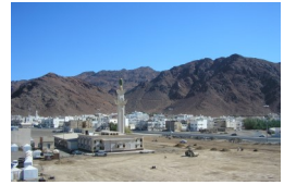
De berg Uhud

Ook door deze gebeurtenis was bij Khalid de bewondering voor de Profeet ﷺ toegenomen. Hij begon onopgemerkt de Boodschapper van Allah te observeren, zijn doen en laten, zijn manier van praten, zijn omgang met de metgezellen, zijn manieren. Al heel snel was hij tot de conclusie gekomen dat de Boodschapper van Allah en zijn metgezellen een heel rein leven aan het leiden waren. Aan deze kant was de Boodschapper van Allah ﷺ niet onbewust van wat er in Khalid's hart afspeelde. De Profeet van Allah ﷺ zei tegen Walied, de broer van Khalid die inmiddels de Islam al had geaccepteerd: "Jouw broer Khalid is nu op de hoogte van de waarheid van de Islam,