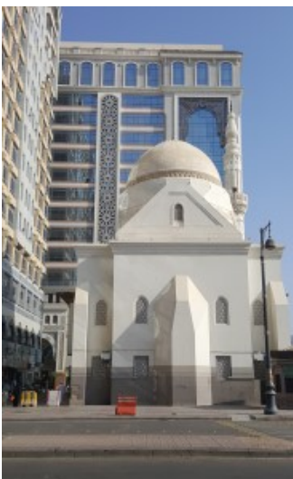
Imam Boekharie Moskee in Madiena-tul-Moenawwarah Zelfgemaakte foto in 2016